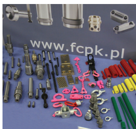
Fot. Normalia firmy FCPK Bytów

INMET-BTH, Pedrotti, Rabourdin S.A.S., Strack Norma i Wadim Plast. Zbyt duża ilość producentów w tabeli na pierwszy rzut oka może sprawiać wrażenie trudnego wyboru, jednakże jest to mylne wrażenie, ponieważ elementy produkowane przez wszystkie firmy współgrają ze sobą harmonijnie, a przede wszystkim są zamienne. Z tego powodu odbiorcy mogą kierować się tym na czym najbardziej im zależy czy na korzystniejszej cenie czy lepszej dokładności wykonania. Rynek normalii