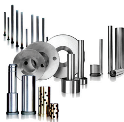
Fot. Normalia Bru y Rubio

W wydaniu 2/2018 Forum Narzędziowego OBERON mamy przyjemność po raz kolejny przedstawić Państwu raport na temat normalii do form i tłoczników. Normalia są istotnymi elementami składowymi przyrządów wytwarzanych w narzędziowniach. Numer dedykowany jest targom Plastpol, które odbędą się w Kielcach. W tym roku to już XXII edycja Międzynarodowych Targów Przetwórstwa Tworzyw Sztucznych i Gumy. W związku z tym raport